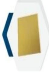
هولند Holland 25x25x6cm