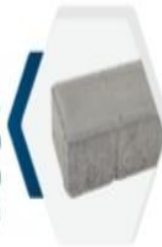
هولند Holland 20x10x6cm 20x10x8cm 20x20x6cm