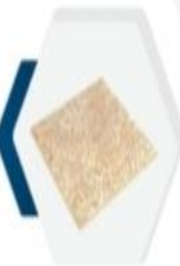
البلاط الناظر Exposed Aggregate Tiles 40x40x4cm