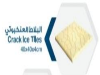
البلاط العنكبوتي Crack Ice Tiles 40x40x4cm