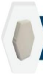
السداسي Hexagon 6cm