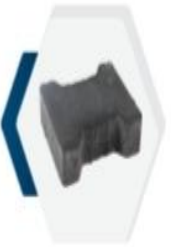
بيشاتون Behaton 6cm 8cm