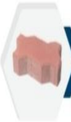
يوني Uni 6cm