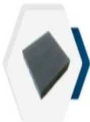
البلاط الإسمنتي Concrete Tiles 40x40x4cm