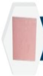
بلاط إسمنتي Concrete Tiles 60x60x6cm