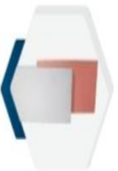
إنترلوك Interlock 60x30x6cm

The three dimensional shape is usually characterized by combination of its three colors together, and it often needs large areas to show the required distinction and beauty.