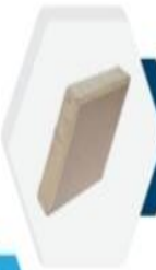
البعد الثالث معين 3D Prisma 6cm

لثاني الأبعاد عادة ما يتمزج بدمج ألوانه الثلاثة مع بعضها ويصنع غالباً لمساحات كبيرة يعطي الميزة والحجم المطلوب